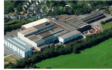
Werk II, Gießerei Waldstraße 52, 57250 Netphen