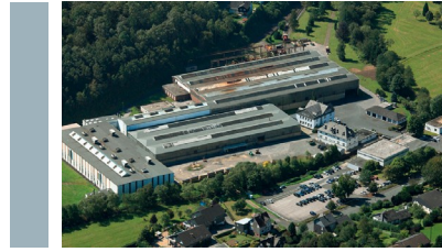
Werk I, Bearbeitung Hüttenweg 5, 57250 Netphen